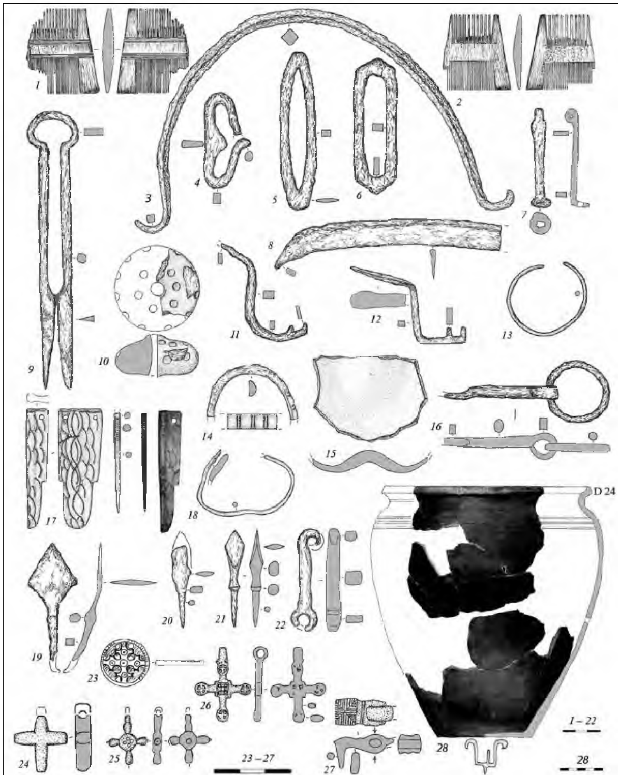
Рис. 1. Побутовий інвентар, вироби військового призначення, прикраси та предмети особистого благочестя з культурного шару та заповнення споруд і таврований горщик із об'єкта № 15.